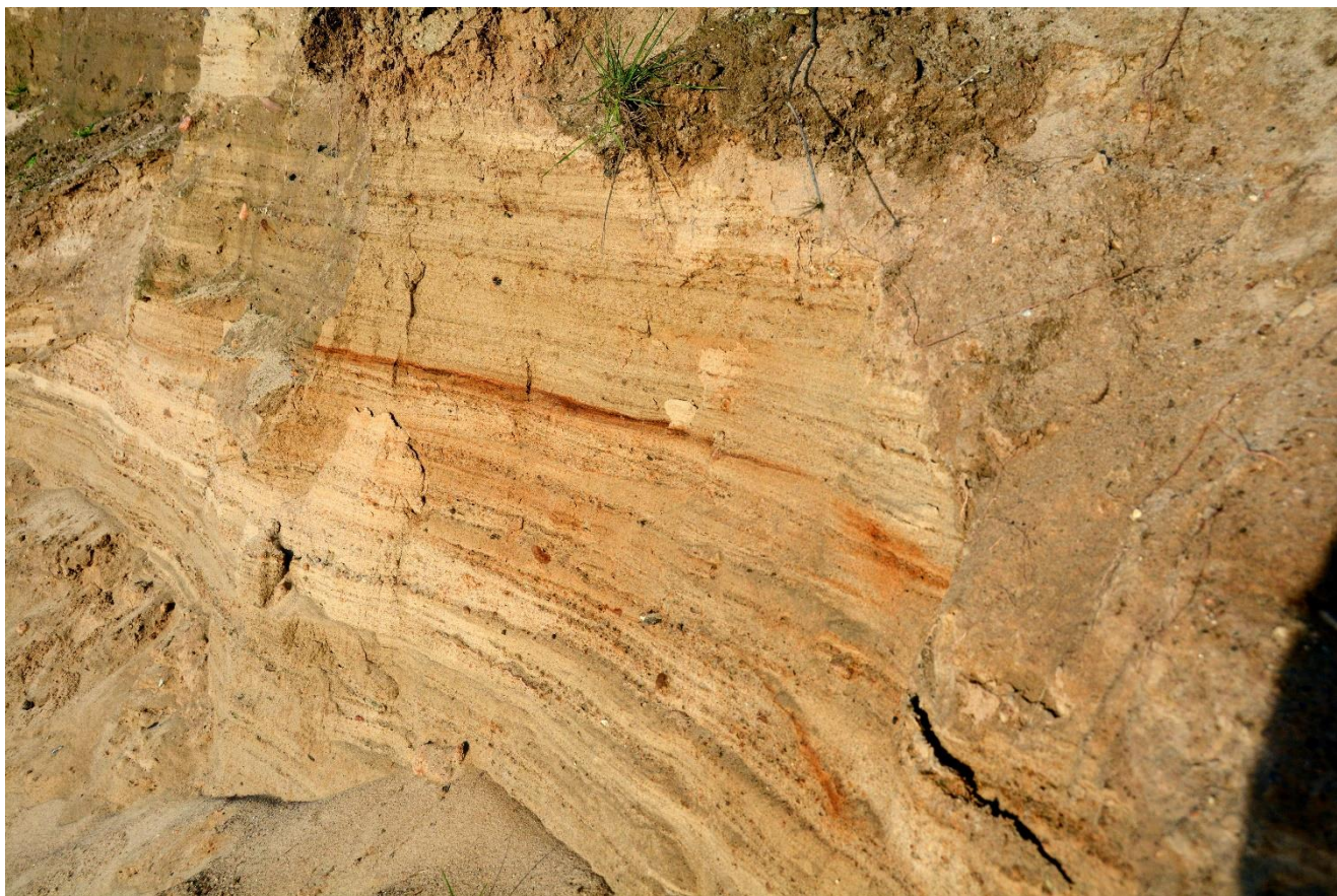
Foto af smeltevandssand ved Dykær

Lagdelt sand aflejret af smeltevand. I nærbillede herunder ses at sandet indeholder en del sten og grus – et udtryk for den variation der har været i vandets hastighed.