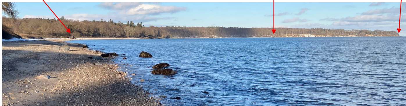
Foto taget 14-02-2026 fra As Hoved 1 tur langs Bøgehoved. Meget lavvandet – mange store sten, der normalt er dækket af vand ses nu tydeligt. Hele As Hoved kysten hen til den strandede pram (tur As Hoved 2) samt ud til Gavlen (tur As Hoved 3) er tydelig.

Bøgehoved består hovedsagelig af moræneaflejringer, der tydelig træder frem en del steder i skrænterne ud mod vandet.